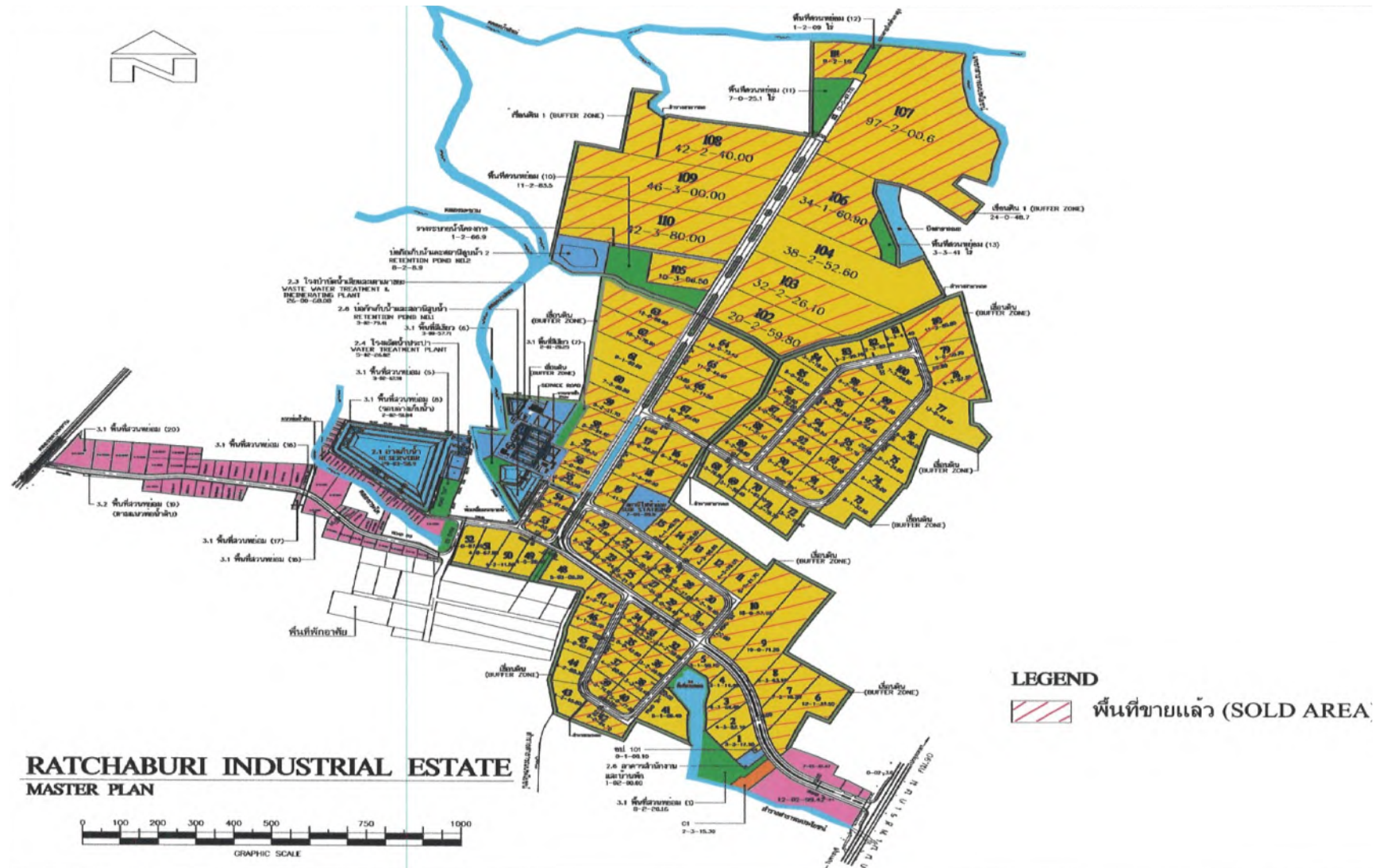
รูปที่ 1.2-2 ผังแสดงขอบเขตพื้นที่นิคมอุตสาหกรรมราชบุรี และรายละเอียดการจัดแบ่งพื้นที่ใช้สอย